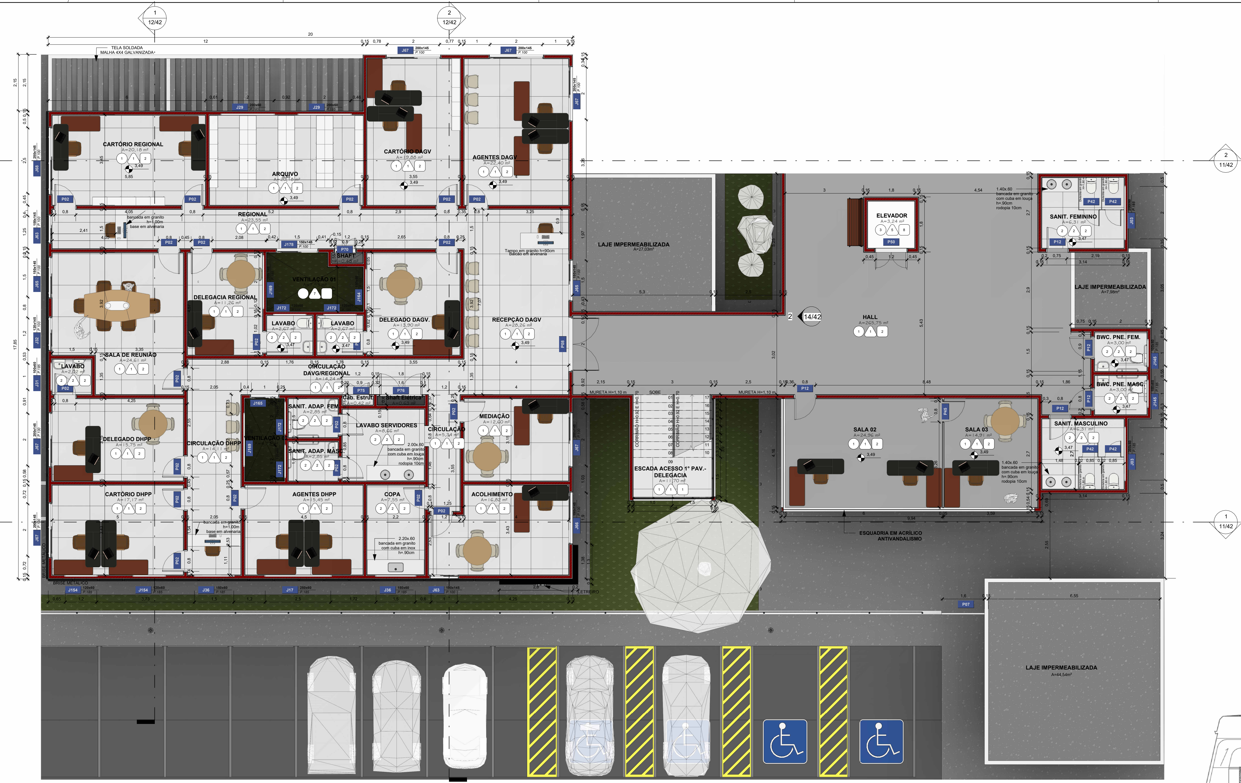
1º ANDAR - DELEGACIA ESCALA 1 : 75